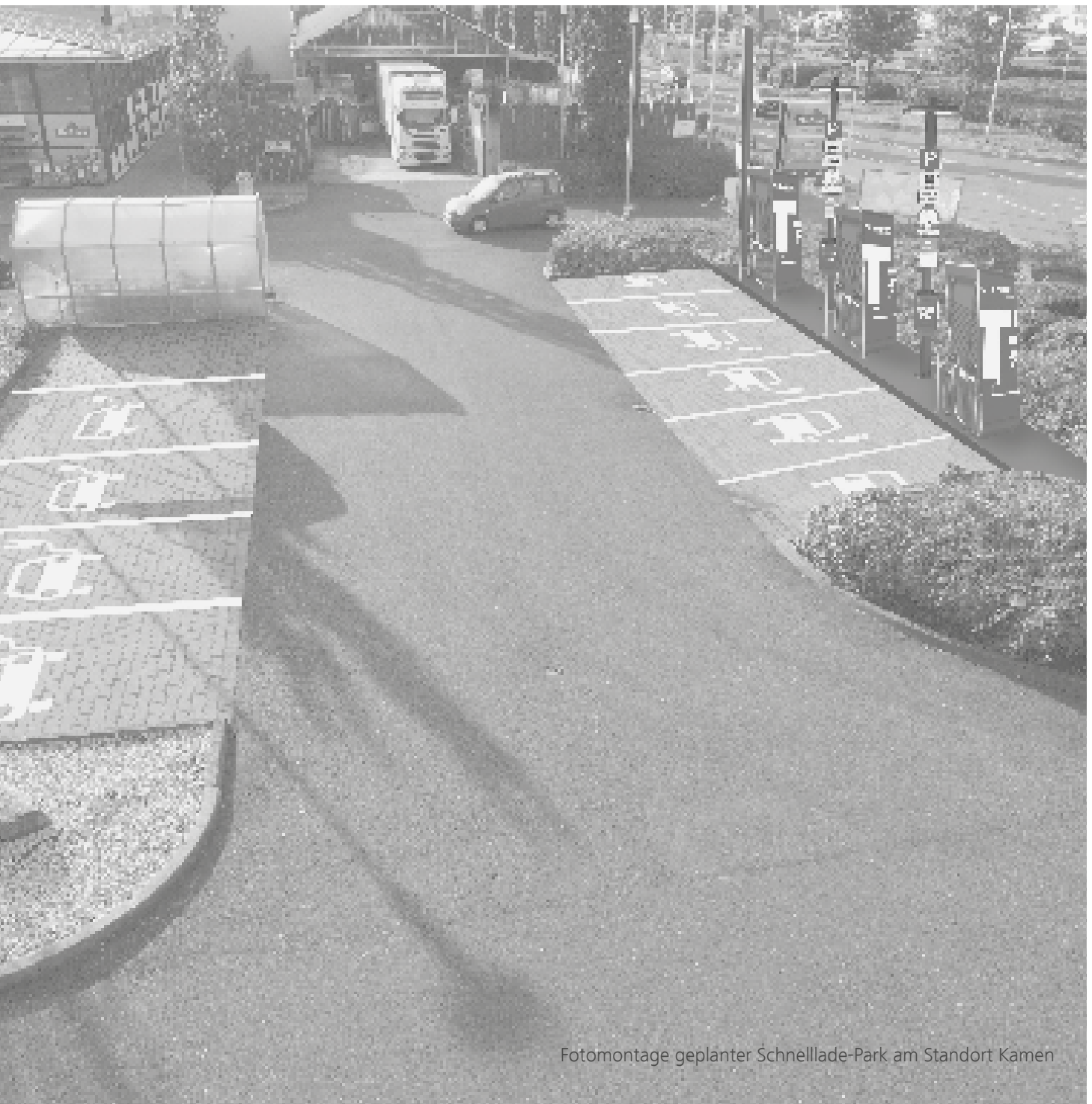
Fotomontage geplanter Schnelllade-Park am Standort Kamen