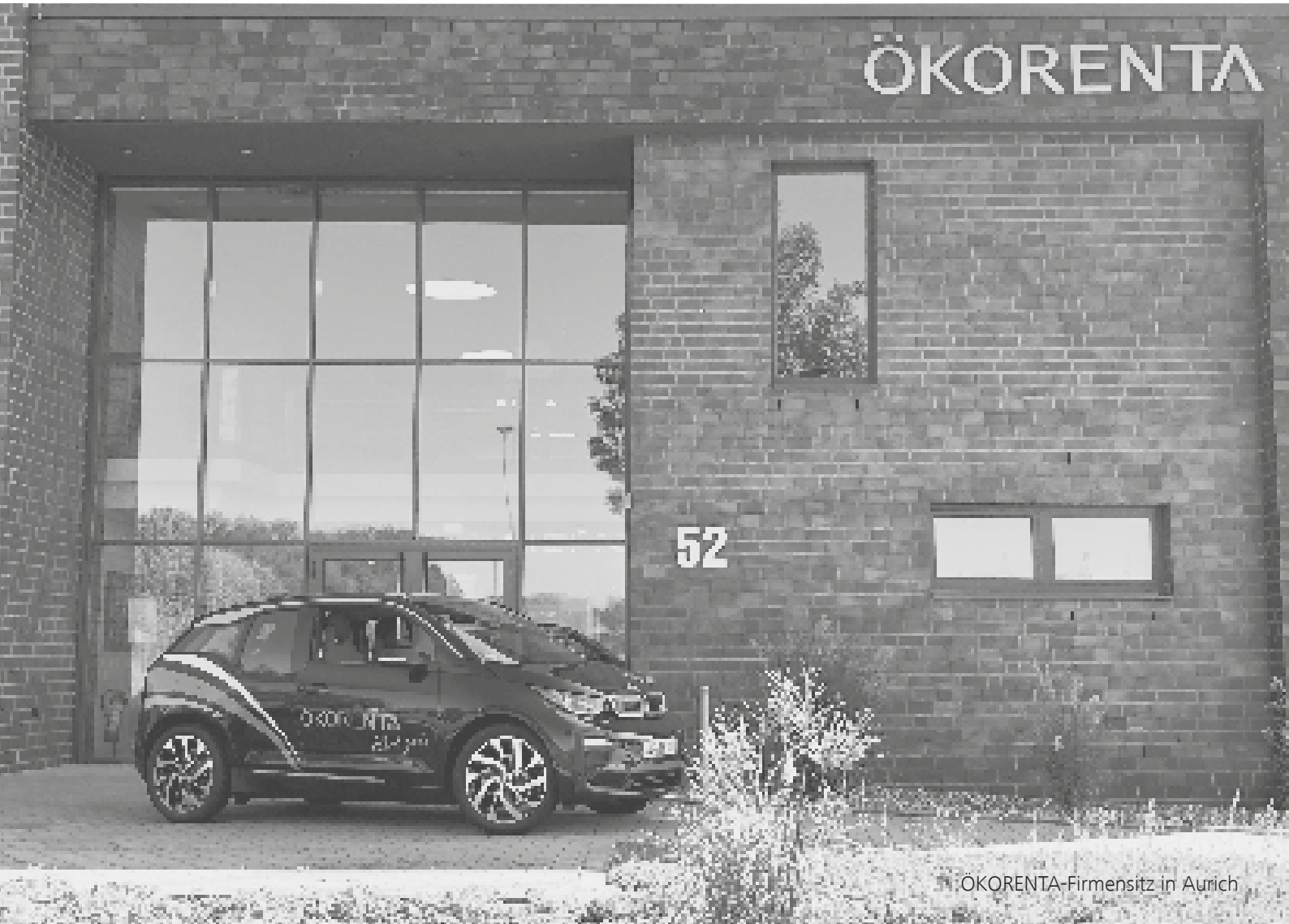
ÖKORENTA-Firmensitz in Aurich