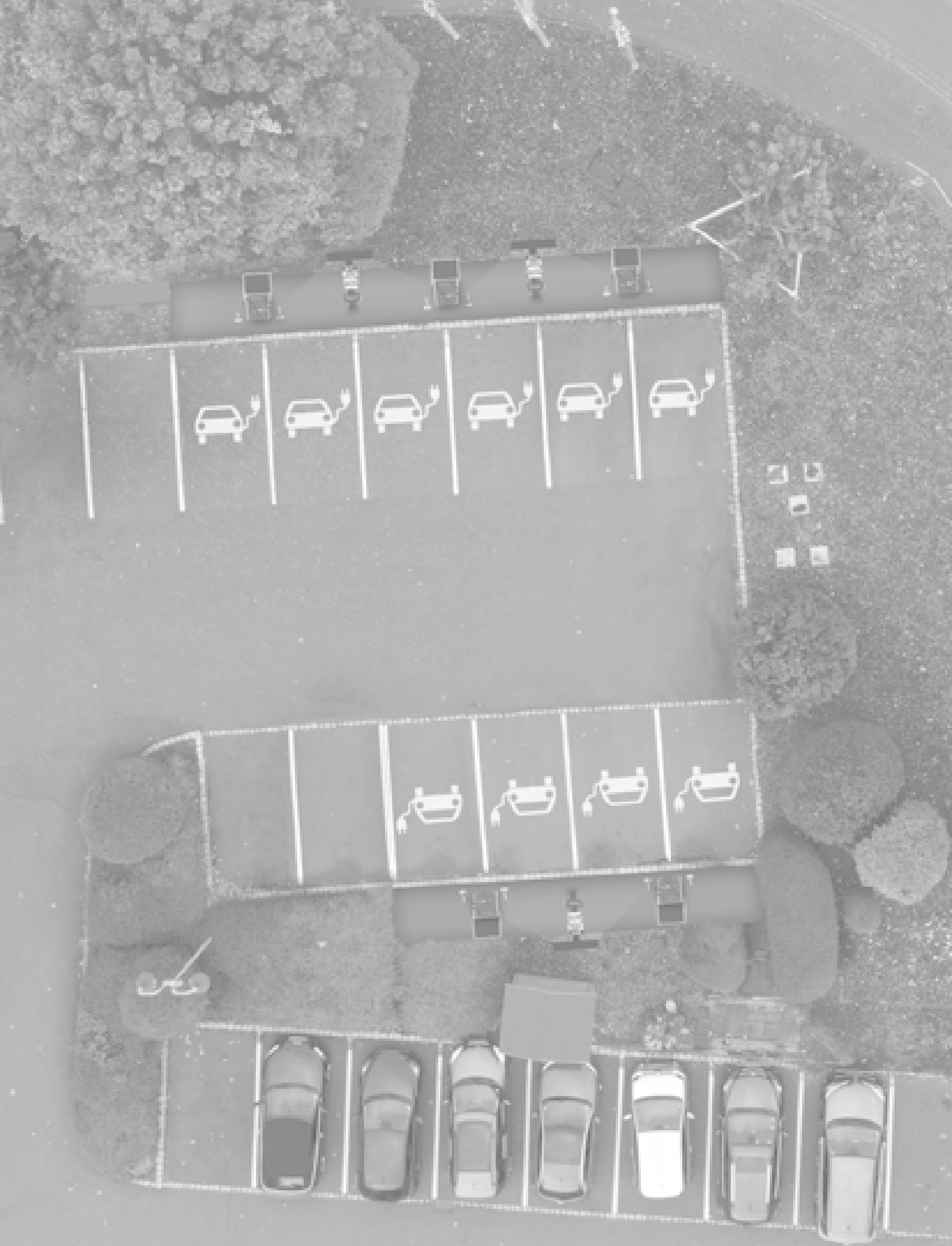
Fotomontage geplanter Schnelllade-Park am Standort Koblenz